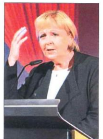
Hannelore Kraft sprach bei der Katag-Cheftagung.

Ein weiteres Thema ihres Vortrags und der anschließenden Diskussion war die Flüchtlingssituation. Händler appellierten an die SPD-Politikerin, endlich für ein Zuwanderungsgesetz Sorge zu tragen. Kraft: »Ich werde den Wunsch gern an unseren Koalitionspartner in Berlin weiterreichen.«