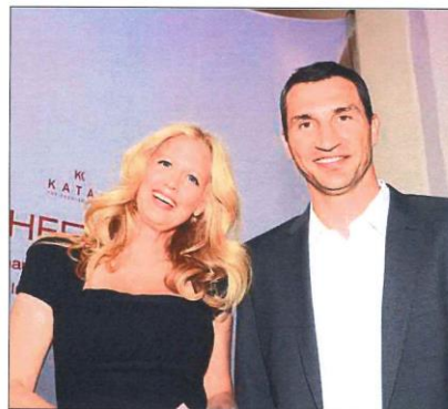
Zwei Stars, die die Katag-Cheftagung zum gesellschaftlichen Ereignis machten: Barbara Schöneberger und Wladimir Klitschko.

Nach dem »Werrepark« in Bad Oeynhausen arbeitet ECE derzeit mit Hochdruck am zweiten OWL-Standort. In der Bielefelder Innenstadt werde Ende des Sommers mit Abrissarbeiten begonnen, sagte Köter. Das neue Center solle 2017 eingeweiht werden. Von den 196 ECE-Shopping-Centern befindet sich die Hälfte in Deutschland.